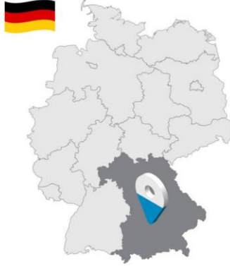
Lage von Bayern