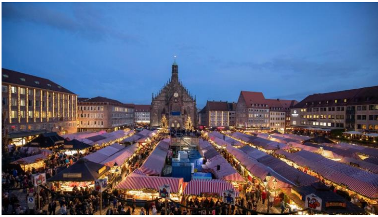
Der Nürnberger Weihnachtsmarkt