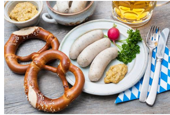
Bretzeln (bzw. Brezn) und Weißwurst mit süßem Senf