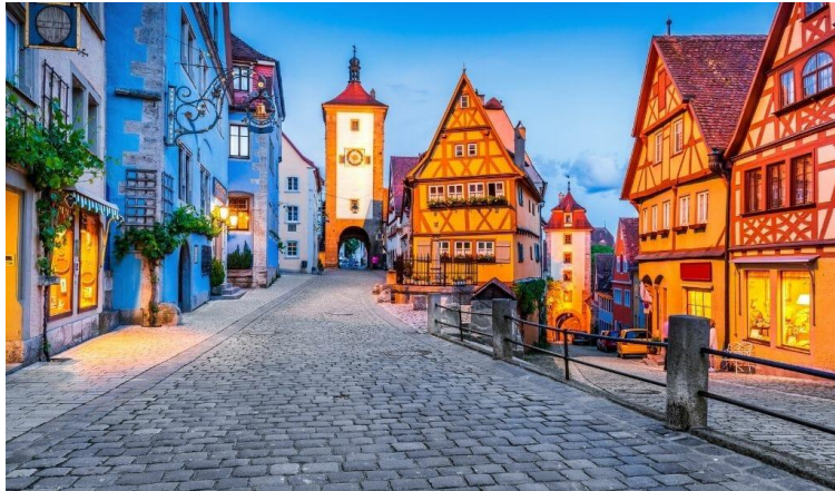
Rothenburg ob der Tauber